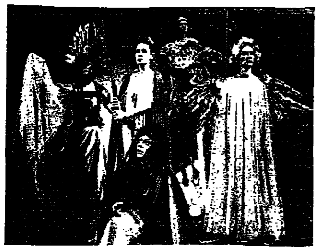
«ليل تشرين» مسرح بولندي، أخرج واتساي وتصميم واجدا